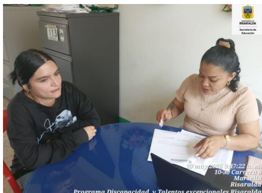
FOTO: Atención acudiente IE Estrada sede principal con fecha de 20 mayo 2026

FOTO: Organización de información de carpetas historias clínicas de la IE Agrícola sede principal con fecha de 14 mayo 2026