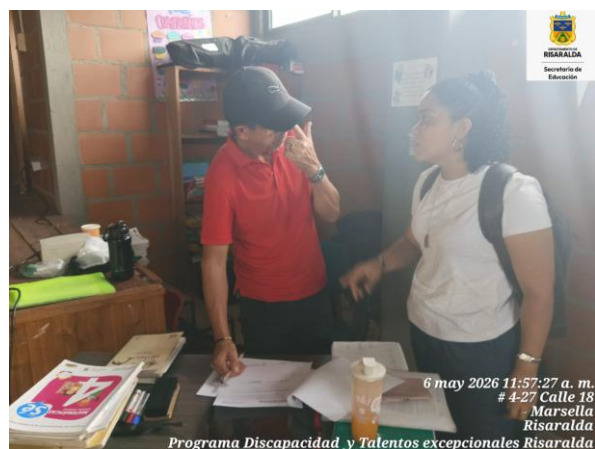
FOTO: socialización con docente de IE Agrícola sede con simón Bolívar con fecha 06 de mayo de 2026.

FOTO: Asistencia técnica en el municipio de Marsella del programa discapacidad y talentos excepcionales con fecha 05 de mayo de 2026