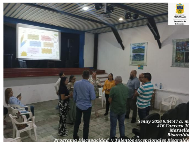
FOTO: Asistencia técnica en el municipio de Marsella del programa discapacidad y talentos excepcionales con fecha 05 de mayo de 2026

FOTO: Atención acudiente con fecha 04 de mayo de 2026.