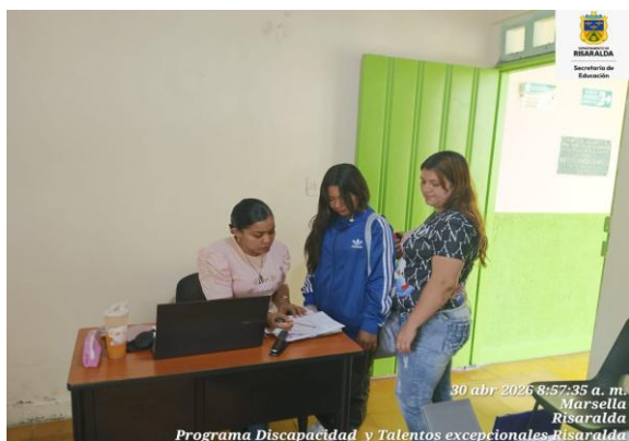
FOTO: Atención acudiente IE Agrícola con fecha 29 de abril de 2026.

FOTO: recepción de información de historias clínicas a carpetas IE Estrada con fecha 29 de abril de 2026.