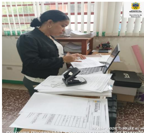
FOTO: recepción de información de historias clínicas a carpetas IE Estrada con fecha 29 de abril de 2026.