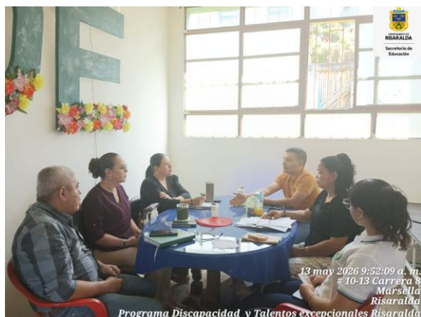
FOTO: comité de inclusión IE Estrada con fecha de 13 mayo 2026