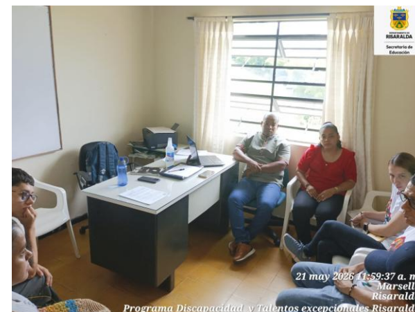
FOTO: Comité de Inclusión IE Agrícola sede principal con fecha del 21 de mayo 2026

FOTO: Atención acudiente IE Estrada sede principal con fecha de 20 mayo 2026