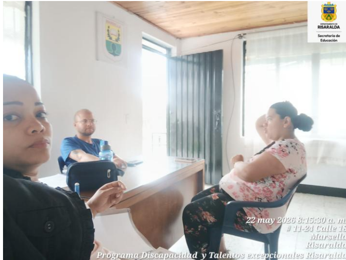
FOTO: Atención acudiente con orientación escolar y PAP IE agrícola sede Maria Inmaculada con fecha de 22 mayo 2026.