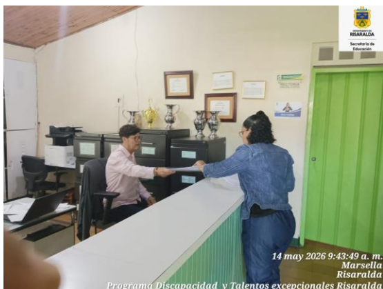
FOTO: Organización de información de carpetas historias clínicas de la IE Agrícola sede principal con fecha de 14 mayo 2026