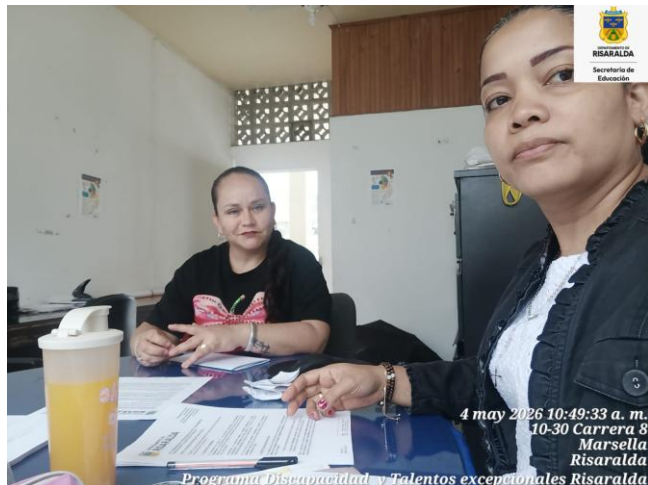
FOTO: Atención acudiente con fecha 04 de mayo de 2026.