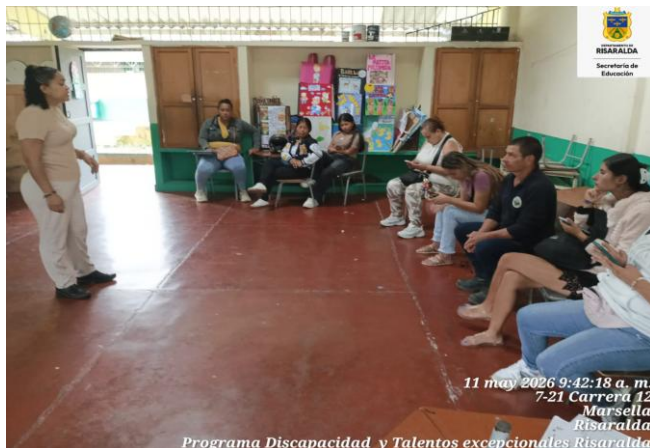
FOTO: Encuentro con padres de familia IE Estrada fecha 11 de mayo de 2026.