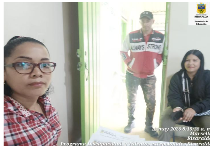
FOTO: Atención a padres de familia de la IE Agrícola sede principal con fecha de 12 mayo 2026.