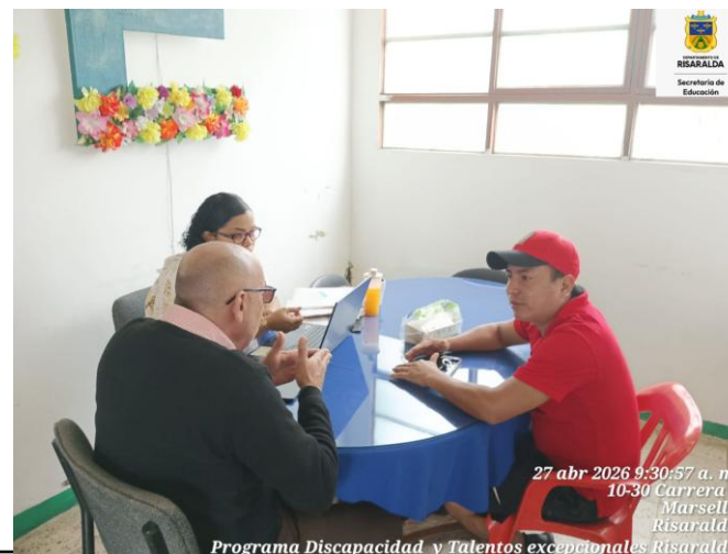
FOTO: Encuentro con acudiente profesional de apoyo y coordinación académica IE Estrada con fecha 27 abril 2026.

FOTO: Atención acudiente IE Agrícola con fecha 29 de abril de 2026.